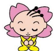
幸手市マスコットキャラクター さっちゃん

https://www.city.satte.lg.jp/soshiki/soumu/2/1/index.html