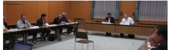
令和6年10月8日 会議の様子