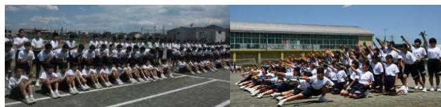
▲凛々しい姿の男子・集団行動 ▲息の合った女子・ソーラン節