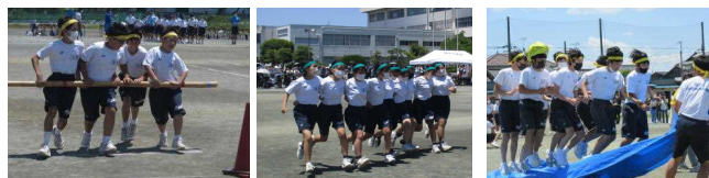
▲各学年の学年種目では、その学年はもちろんのこと、学年を越えて、団が丸となって応援する姿が見られました。

保護者の皆様には、新型コロナウイルス感染症対策のため、人数制限や健康カードチェック等ご不便をおかけいたしました。ご協力をいただき誠にありがとうございました。また、PTA本部役員、広報委員の皆様にも受付や交通整理、写真撮影等、大変お世話になりました。ありがとうございました。