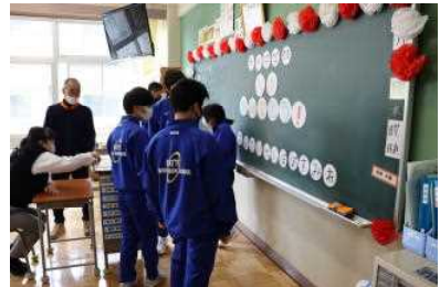
▲ あじたんすみれ学級の様子

いよいよ令和4年度がスタートしましたが、新型コロナウイルス感染症は未だ予断を許さない状況が続いています。新型コロナウイルス感染症拡大防止のため、毎日の検温や健康観察、マスクの常時着用、手洗い・手指消毒など、引き続きご協力をお願いいたします。学校でも感染対策を取りながら、幸手中学校が子供たちにとって豊かな学びの場となるよう教育活動を進めてまいります。今後ともご協力をお願いいたします。