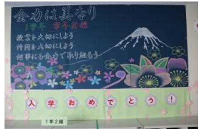
▲ 1年生昇降口の掲示物