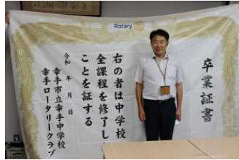
▲名前のところに入って記念撮影できます!