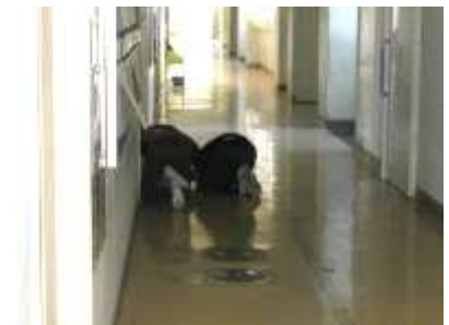
初期対応の実態調査