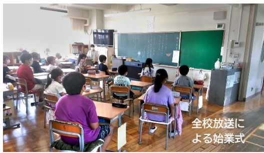
全校放送による始業式

さて、8月20日の始業式の時に、子供たちに2学期がんばることということで2つの話をしました。