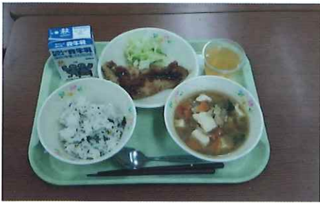
〈メニュー〉 わかめごはん 牛乳 とんかつ ゆでキャベツ 味噌汁 手作りオレンジゼリー

主なテーマ、「朝食について」では、『現代の「こ」食』に着目し、いろいろな「こ」食を説明していただきました。