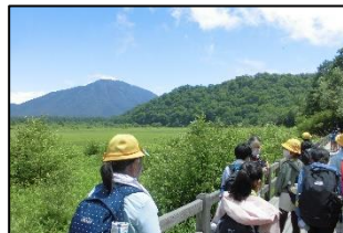
小田代ヶ原のハイキング

5年生が林間学校を実施しました。栃木県日光市方面に行き、初日は小田代ヶ原のハイキングや華厳の滝の見学、キャンプファイヤーを行いました。2日目は、霧降高原でのハイキングや輪王寺・日光東照宮の見学、磐梯日光店で買い物等を行い、参加児童は全員無事に学校に帰ってきました。出発式や帰校式では、たくさんの保護者の方に学校まで見送りやお迎えに来ていただきました。お忙しい中、ありがとうございました。