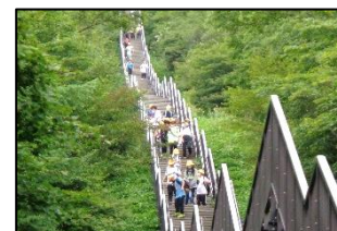
霧降高原のハイキング