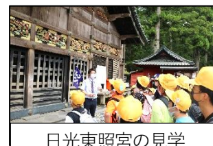
日光東照宮の見学