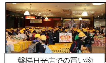
磐梯日光店での買い物

上高野小学校のホームページのQRコードです。学校生活の様子を紹介しています。ぜひ、ご覧ください。